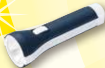
③ LED ライト