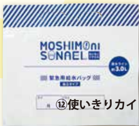
② 給水バッグ 3L