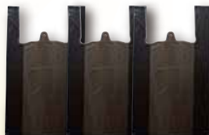
⑧ ポリ袋 (3枚)